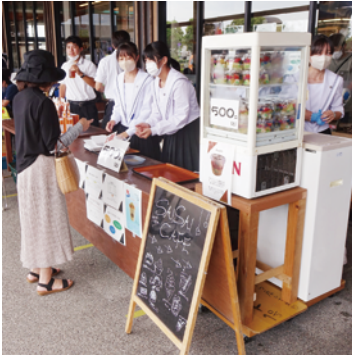
ZEST (総合的な探究の時間)