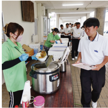
昼休みのお弁当・パン販売