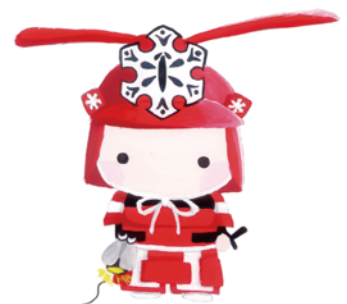
今治西高校 マスコットキャラクター にしとら