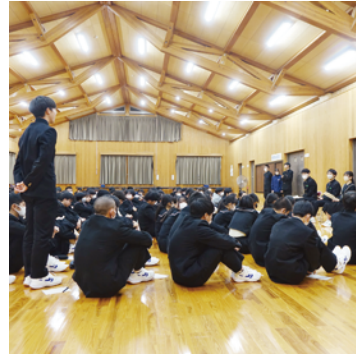
進路座談会で先輩に質問